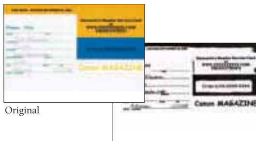
Gescannt im "Text-Verbesserungs-Modus"