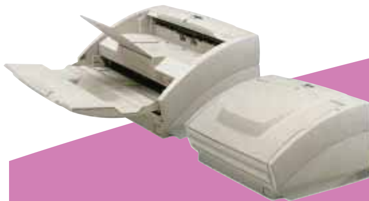
DR-3080C und DR-3060

Andere Funktionen: Zählmodus Scannen von Bereichen Automatische Ausrichtung über Software Rot/Grün/Blau als auszublenkende Farben (nur DR-3080C) Dokumenten Zählwerk in der Firmware