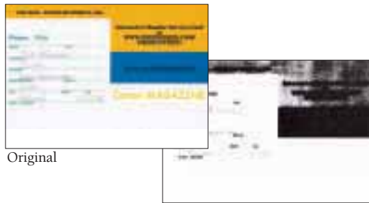
Gescannt im S/W-Modus