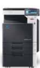
bizhub mit Ablage