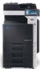
bizhub mit Original- Einzug