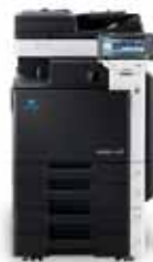
bizhub mit Heftfinisher