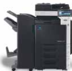
bizhub mit Broschüren-Finisher