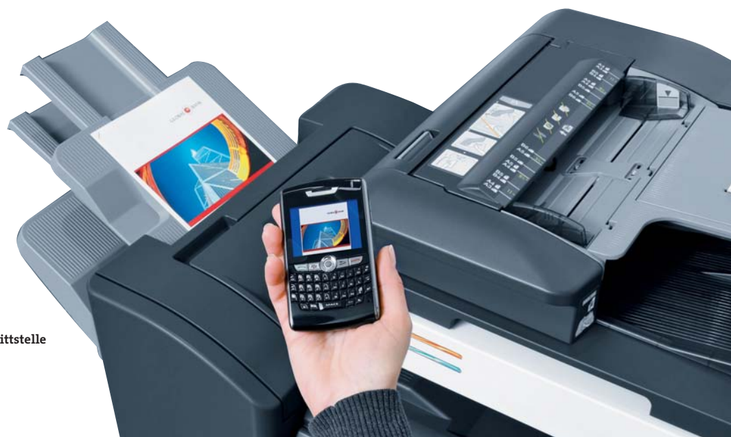
Mobiles Drucken über optionale Bluetooth-Schnittstelle