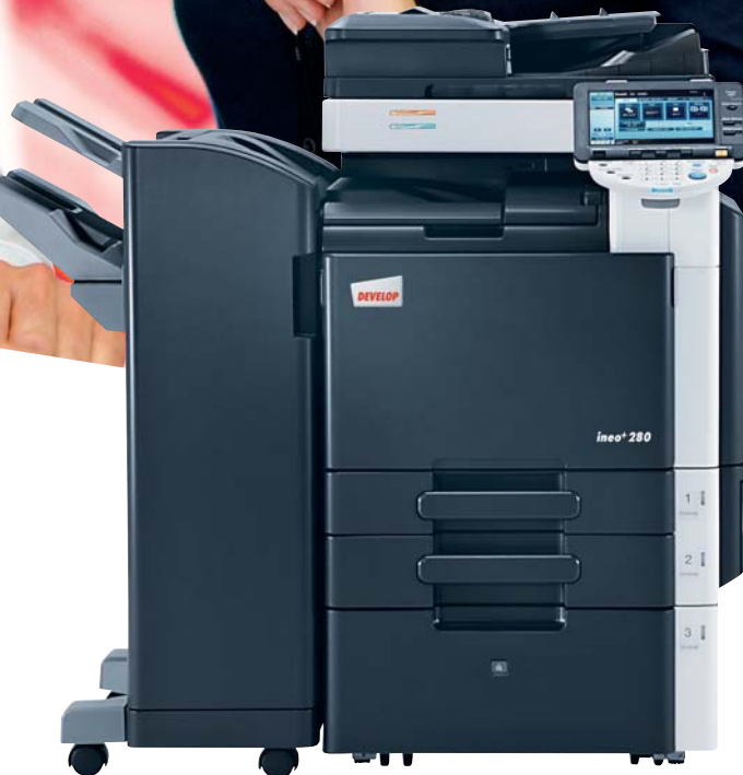
ineo+ 280 mit Originaleinzug (DF-617), Standfinisher (FS-527) und Großraumkassette(PC-408)