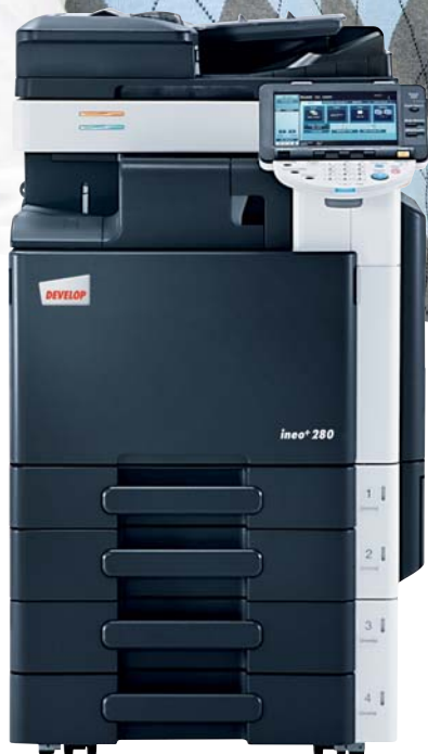
ineo+ 280 mit Originaleinzug (DF-617), Integriertem Finisher (FS-529) und 2 x 500 Blatt Papierkassette (PC-207)